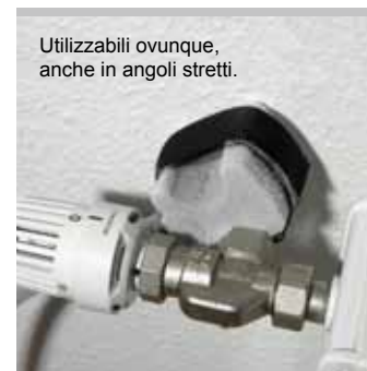
Utilizzabili ovunque, anche in angoli stretti.