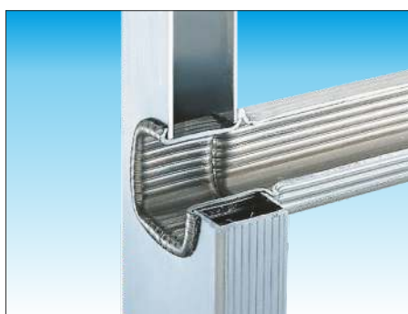
Attacco gradino - montante con doppia bordatura